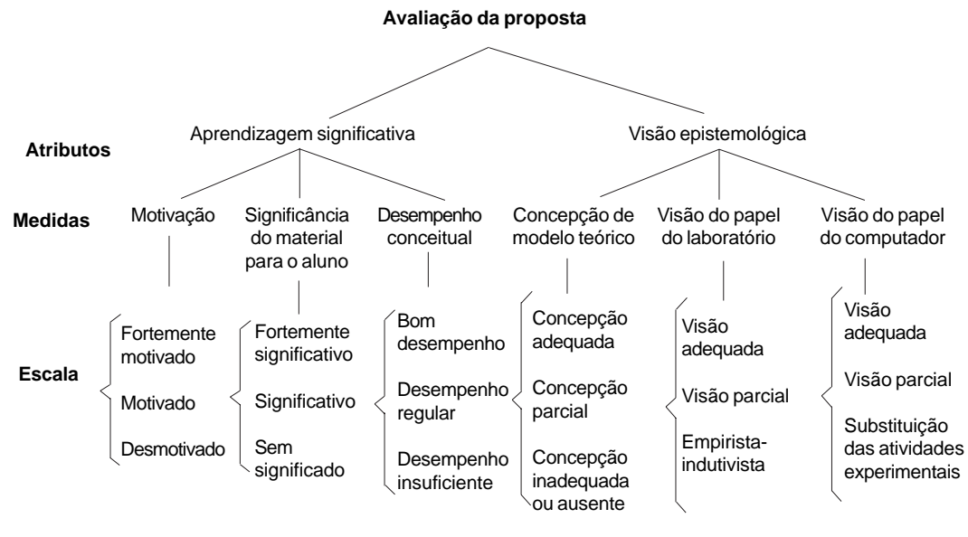
Figura 2. Esquema de avaliação de nossa proposta didática (DORNELES, 2010).

Consideramos que nosso material possui estrutura lógica, pois foi validado por dois especialistas no assunto (professores das aulas teóricas e experimentais, segundo e terceiro autor do presente trabalho, respectivamente). Em relação aos alunos possuírem conhecimento prévio em sua estrutura cognitiva, para acompanharem as explicações e os raciocínios propostos no material, buscamos indicadores sobre o desempenho dos alunos nas tarefas e opiniões sobre o material.